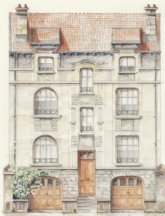
11 Rue Paul Doumer • Pascale Simon • 2025

2026 : Saint-Max rayonne à la manière Art Déco. Dessiner l'avenir avec élégance pour l'élan de demain.