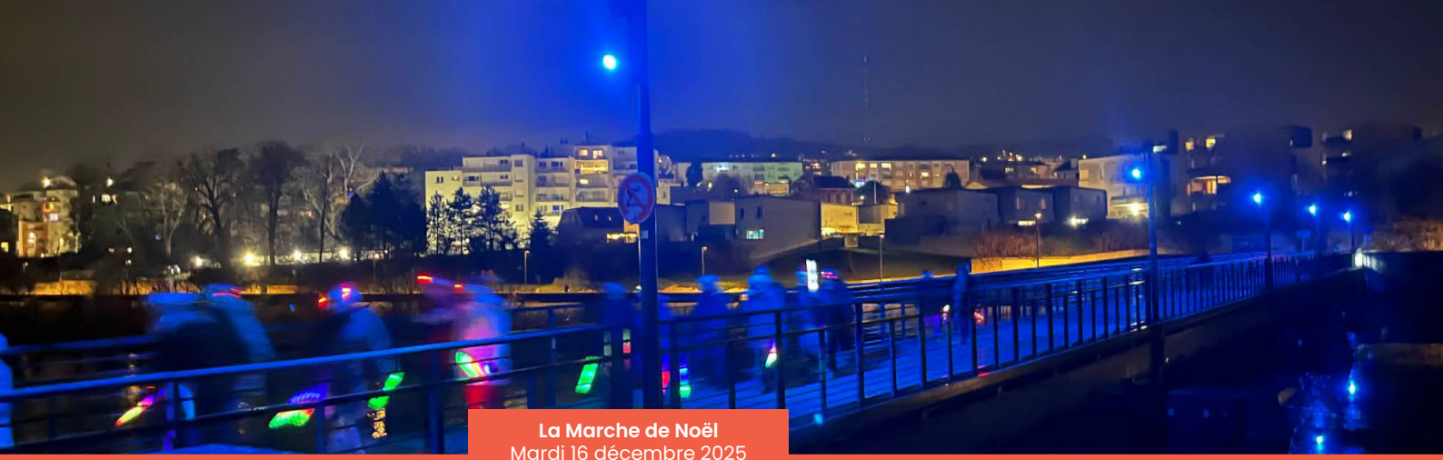
La Marche de Noël Mardi 16 décembre 2025