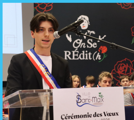
Cérémonie des vœux 2026 Lundi 12 janvier 2026