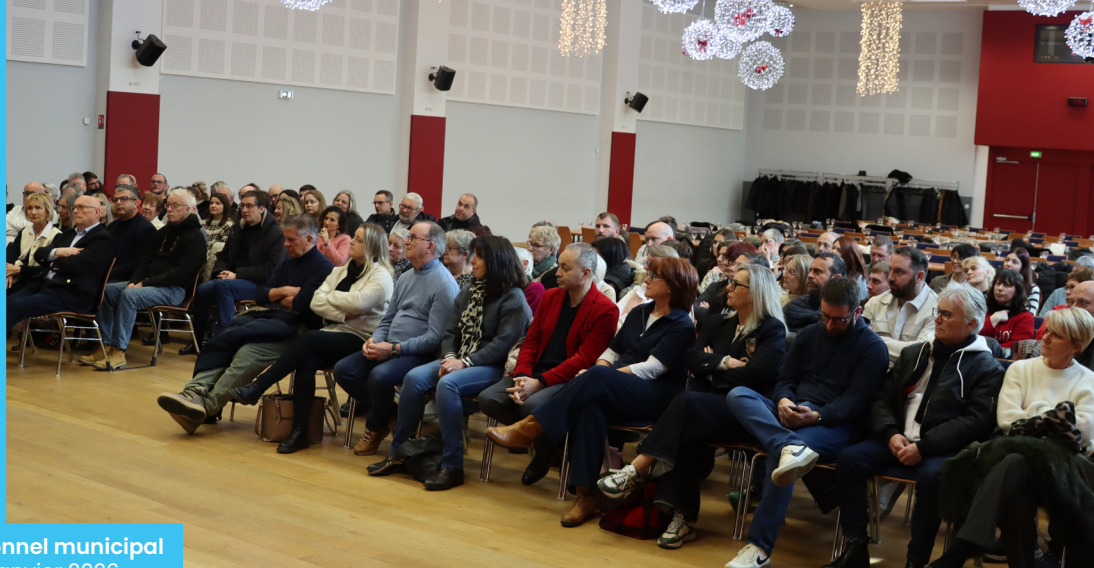
Vœux au personnel municipal Mercredi 7 janvier 2026