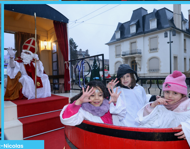
Défilé de Saint-Nicolas Dimanche 7 décembre 2025