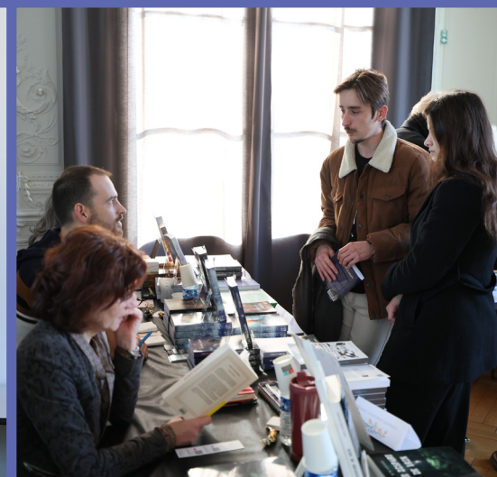
Salon du Livre au Château Samedi 22 novembre 2025