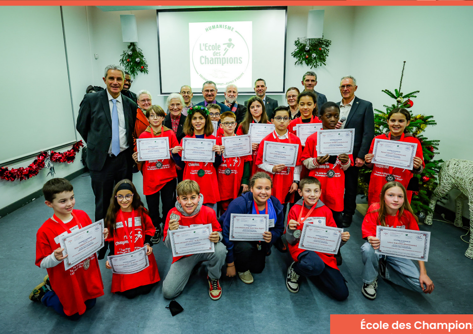
École des Champions Vendredi 19 décembre 2025