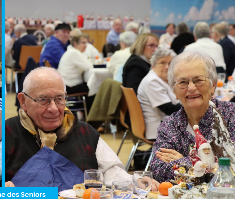
Repas Calme des Seniors Mardi 9 décembre 2025