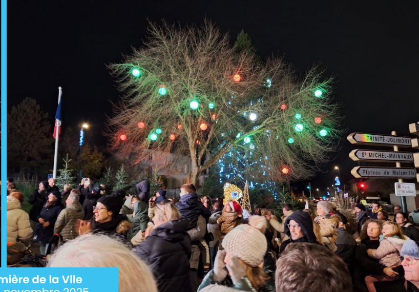
Mise en lumière de la Ville Vendredi 28 novembre 2025