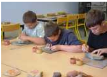
Atelier Arts Plastiques