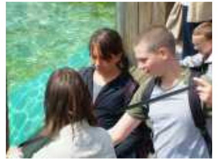
Devant le bassin des otaries à Amnéville