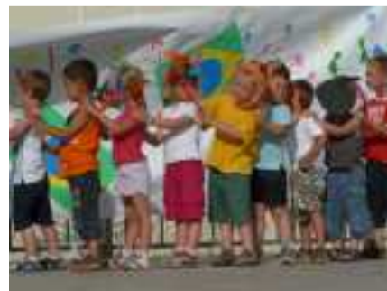
La danse des animaux

Il ne faut pas oublier les journées thématiques : cirque, pays étranger... et toute la préparation nécessaire aux spectacles que les enfants proposent aux parents à la fin de chaque session !