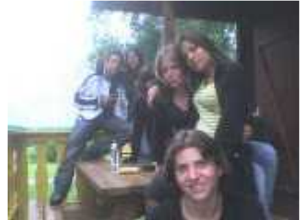
Au camps de Langatte début juillet