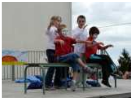
Le numéro de mimes de la fête d'août

Les jeunes Maxois, âgés de 3 à 13 ans, peuvent profiter des activités proposées par l'Accueil de Loisirs Jean Rostand qui fonctionne pendant toute la période estivale de 9h00 à 17h00.