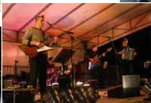
< L'Orchestre de Yannick Pascal