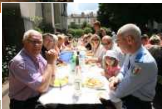
< Grandes tablées du Pique-Nique Républicain