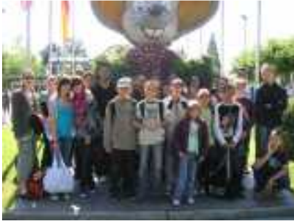
A nous Europa Park !

Le Pôle Jeunesse de Saint-Max a proposé des animations variées aux adolescents pendant l'été. Au programme : des activités sportives, des sorties ludiques et culturelles et quelques activités manuelles.