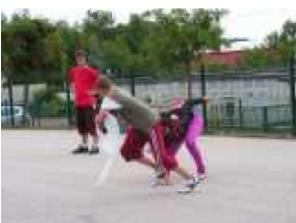
Jeux dans la cours du centre