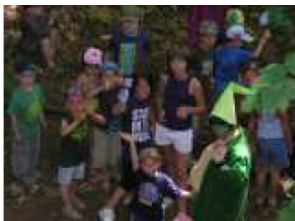
Grand jeu sur le plateau de Malzéville