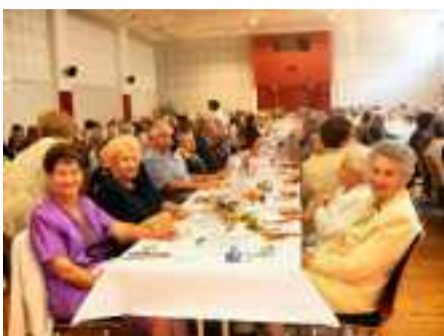
Repas calme en 2007

Nous vous invitons à vous inscrire , à l'un ou l'autre des repas (en fonction de vos disponibilités et vos envies) à partir du 15 septembre .