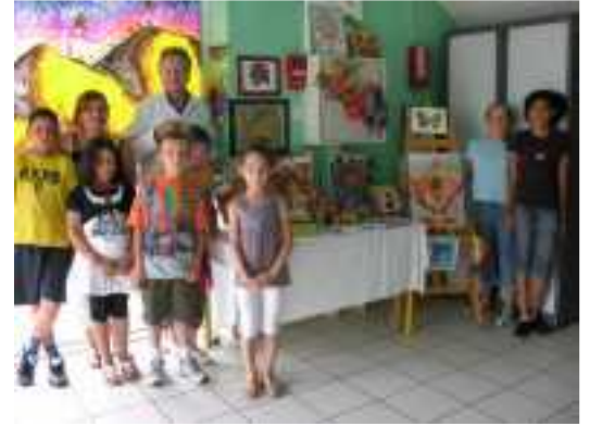
Le peintre et les artistes en herbe

Cadres lumineux, masques, village provençal, foulards en soie... Chaque enfant crée en fonction de ses goûts et de son inspiration.