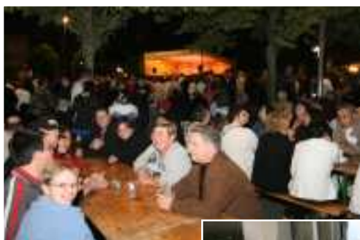
< Bonne ambiance au bal du 13 juillet