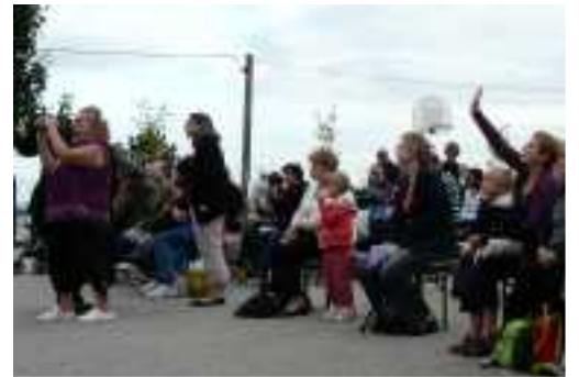
Les parents lors du spectacle en août

Les dates d'ouvertures ont été rallongées de trois jours afin de répondre à une demande des familles. La direction du centre s'est efforcée de prendre en compte l'ensemble des remarques formulées. Tout ceci a concouru à l'amélioration de l'accueil des enfants et à la satisfaction des parents. Le bilan de l'Accueil de Loisirs 2008 est grâce à cette démarche qualité très positif.