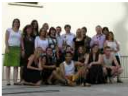
Les animateurs du mois de juillet