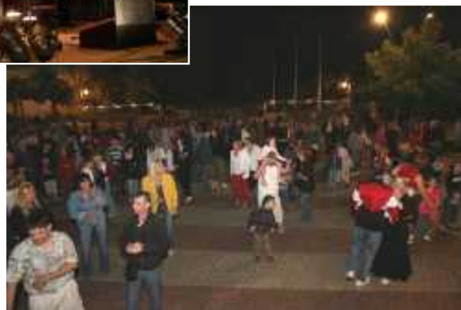
^ Danseurs au bal du 13 juillet