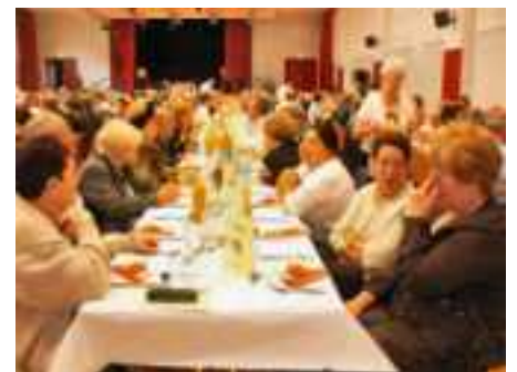
Repas dansant en 2007

Ils sont proposés au choix des Anciens de la commune par la Municipalité et le C.C.A.S. Tous deux se tiendront à midi dans la grande salle du Foyer Culturel Gérard Léonard.