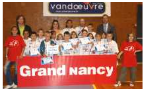
L'équipe maxoise récompensée de ses efforts.

C'est aussi la rentrée pour l'Ecole des Champions : le 19 novembre le gymnase Henri Cochet à Saint-Max accueillera l'ensemble des enfants de l'est de l'agglomération.