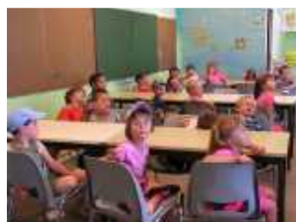
A la cantine