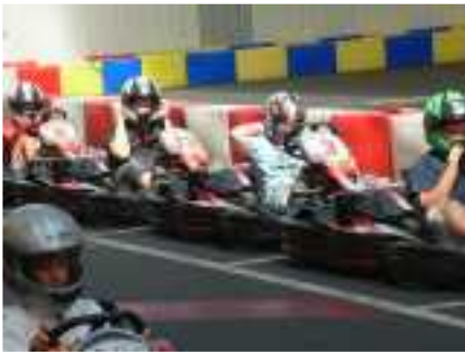
Sensations fortes au karting