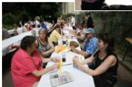
< Grandes tablées du Pique-Nique Républicain >