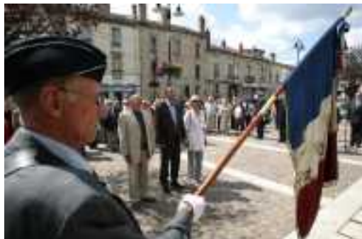
< Cérémonie devant le monument aux morts

A l'occasion de la fête nationale, la municipalité a proposé un pique-nique républicain le lundi 14 juillet. Une initiative couronnée de succès.