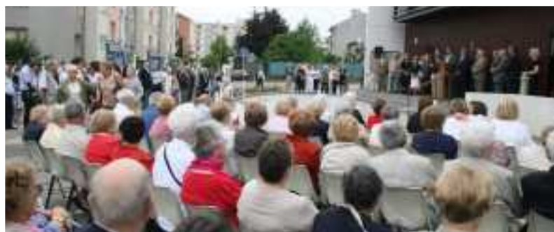
Une dénomination chargée d'émotion ^